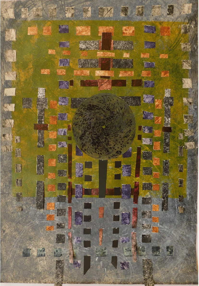
Kilim III, 70x100cm (2020)