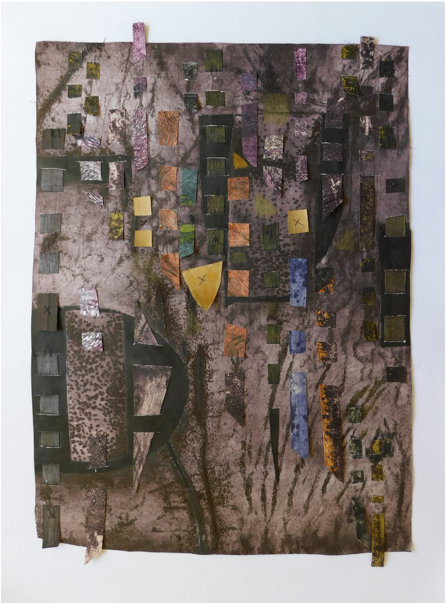
Kilim X, 55x78cm (2021)