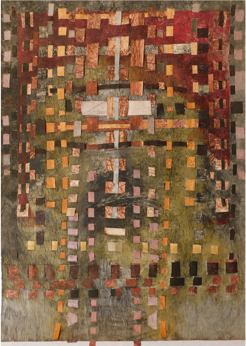
Kilim I, 70x100cm (2020)